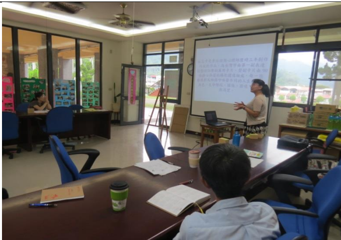
紅花卡功能與簡介。