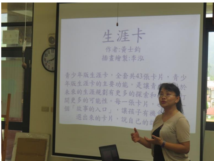
生涯卡功能與簡介。