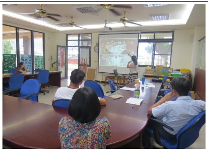
家庭教育研習成果概況說明。