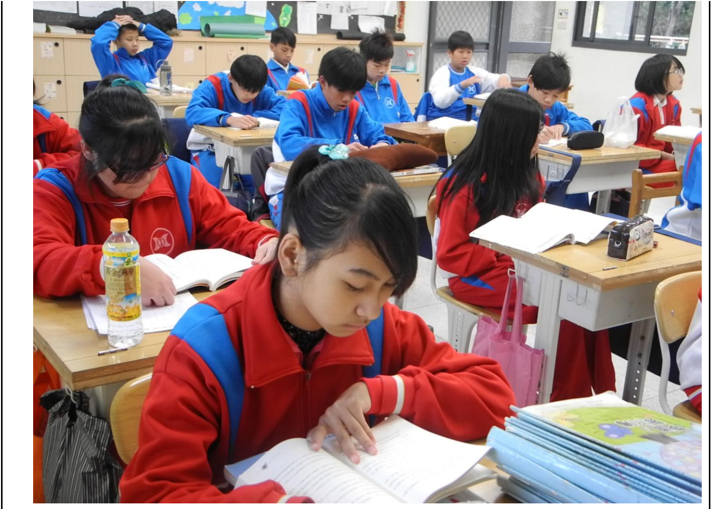
推動班級晨讀活動照片