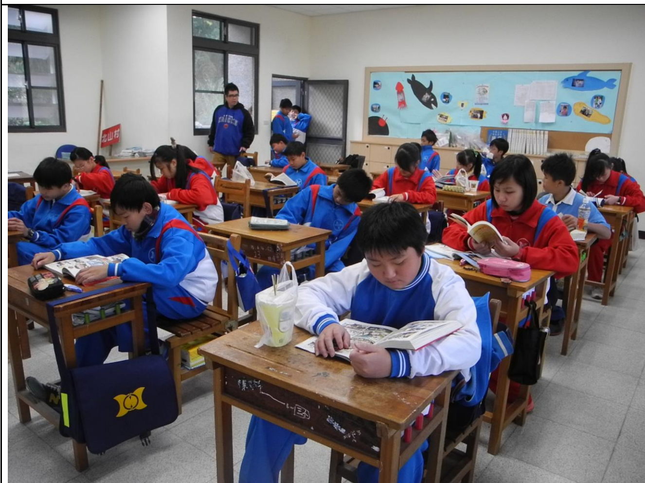
推動班級晨讀活動